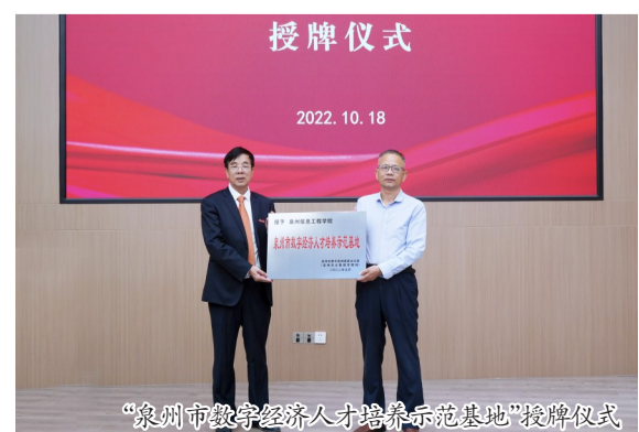
“泉州市数字经济人才培养示范基地”授牌仪式

授牌仪式后,嘉宾们在学校领导陪同下,参观我校泉州智能制造公共实训基地、增材制造创新中心、ICT产教融合基地、德国工业4.0实验中心、电工电子实验中心等。