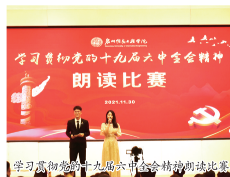
学习贯彻党的十九届六中全会精神朗读比赛

本报讯 为学习宣传贯彻党的十九届六中全会精神,持续推进党史学习教育走深走实,教育引导广大师生牢牢把握核心要义,坚定理想信念,11月30日晚,泉州信息工程学院学习贯彻党的十九届六中全会精神朗读比赛在教学楼JB209报告厅举行。