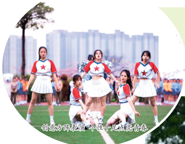
创意方阵表演 个性十足点燃青春

本报讯 11月18日至20日,泉州信息工程学院第十五届田径运动会如期举行。858名运动健儿充分发扬体育精神,在赛场上团结拼搏,奋力争先,彰显了泉信人积极昂扬、勇攀高峰的精神风貌。