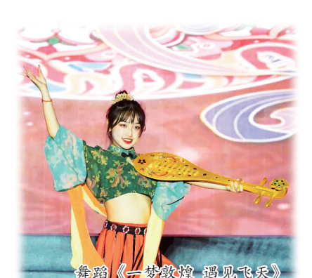
舞蹈《一梦敦煌 遇见飞天》

斗努力学习的青春激情,确保“七一”重要讲话精神落地生根。未来,泉信师生将不忘初心携手前行,为祖国的繁荣昌盛贡献自己的力量。