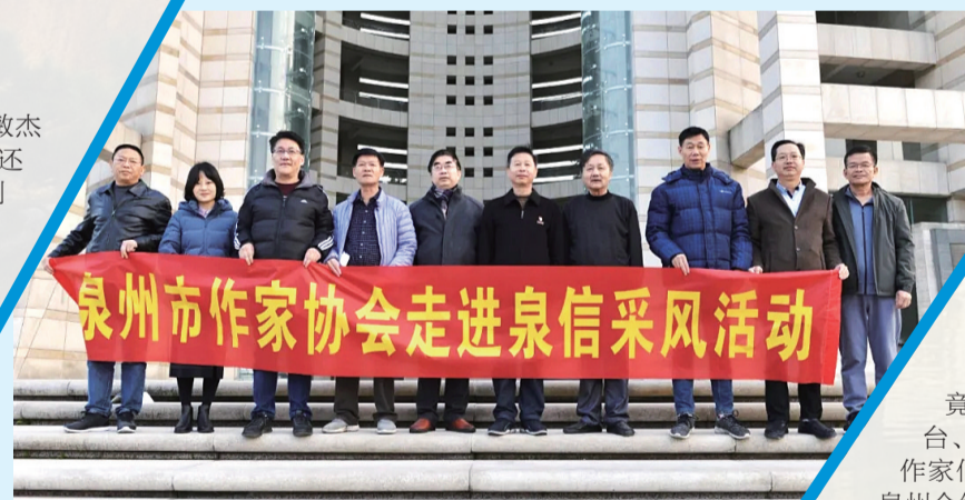
泉州作家协会一行在我校合影

参访团一行参观了校园,实地调研了我校泉州市智能制造公共实训基地、国家增材制造创新中心福建应用中心、ICT产教融合基地、德国工业4.0实验中心等。在参访过程中,集美大学一行对我校的发展、建设表示高度赞赏,并感谢我校为本次调研提供的支持与服务。