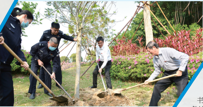
警察蜀黍到我校开展植树节活动

响应习总书记的号召,以实际行动践行“绿色发展是构建高质量现代化经济体系的必然要求”,一起为泉州的大地绿起来、美起来尽一份力量,努力为建设青山常在、绿水长流、空气常新的美丽泉州而努力奋斗。