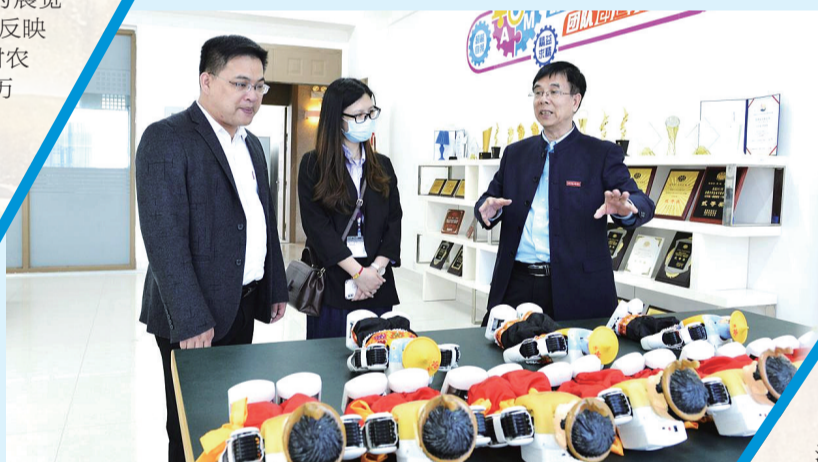
半导体高新区领导与企业莅校洽谈